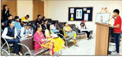
रादौर : भाषण के दौरान अपने विचार रखता छात्र।