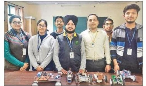
यमुनानगर। रादौर स्थित जेएमआईटी शिक्षण संस्थान में आयोजित कार्यक्रम में अपने द्वारा बनाए गए आकर्षक प्रोजेक्ट्स को प्रदर्शित करते विद्यार्थी।

इस प्रकार के आयोजन विद्यार्थियों के भविष्य के लिए कारगर साबित होते हैं। विद्यार्थी भविष्य में प्रयोग होने वाली