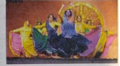
मनमोहक अंदाज में रंगारंग कार्यक्रम प्रस्तुत करते छात्र।