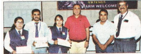
प्रतियोगिता विजेताओं को सम्मानित करते मुख्यातिथि। संकाय

यमुनानगर। तिलक राज चढ़ा प्रबंधन एवं तकनीकी संस्थान में इंटर कॉलेज केस विश्लेषण एवं प्रस्तुतीकरण प्रतियोगिता कराई गई। जिसमें प्रबंधन एवं तकनीकी संस्थानों की 12 टीमों ने भाग लिया। इसमें रादौर की जेएमआईटी की टीम प्रथम रही।