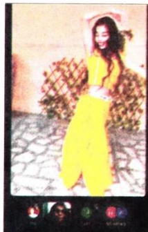
टैलेंट शो में नृत्य करती छात्रा। (मलिक)

रादौर, 16 जनवरी (मलिक): हमारे देश के युवाओं की प्रतिभा का लोहा आज विश्वभर में माना जाता है और देश के हर गांव नगर और शहर में प्रतिभाओं की भरमार कही जा सकती है। युवा वर्ग को अपनी प्रतिभा दिखाने का मंच प्रदान करते हुए रादौर के सेट जयप्रकाश मुकंद लाल इंजीनियरिंग कॉलेज में टैलेंट शो प्रतियोगिता का आयोजन किया गया। इस प्रतियोगिता का आयोजन कुरुक्षेत्र विश्वविद्यालय के सौजन्य से किया गया। इसमें विद्यार्थियों ने साहित्यिक, सांस्कृतिक, फाइन आर्ट्स, गीत, नृत्य और अभिनय में प्रतिभा दिखाई।