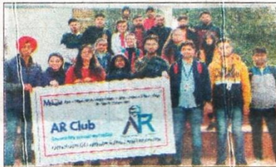
कार्यक्रम में उपस्थित विद्यार्थी।