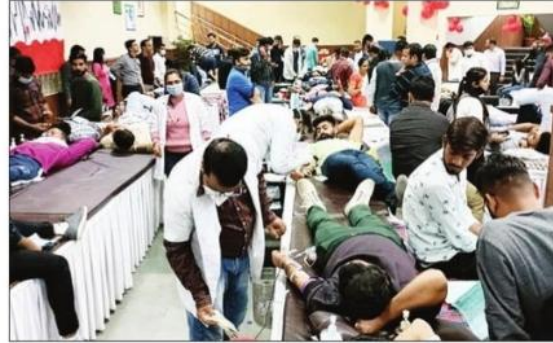
रक्तदान शिविर में रक्तदान करते विद्यार्थी।